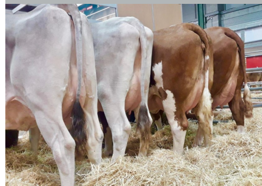
Top Genetik aus Österreich, im Bild zwei Braunvieh –und zwei Fleckviehkühe aus den Verbandsgebieten des FIH und des RZO.

kaufgespräche ergaben. Sogar in mehreren Fernsehbeiträgen wurde über den österreichischen Messeauftritt berichtet. Bereits in den 80er Jahren war die ZAR regelmäßig an diesem Standort vertreten, damals noch bekannt als „Semana Verde“. Bei der CIMAG - GANDAGRO nehmen jedes Jahr rund 200 Aussteller aus mehreren Ländern und mehr als 21.000 Besucher teil. Der Schwerpunkt der Messe liegt auf Rinderzucht, da die Region Galizien auch die dichteste Rinderpopulation in gesamt Europa aufweist.