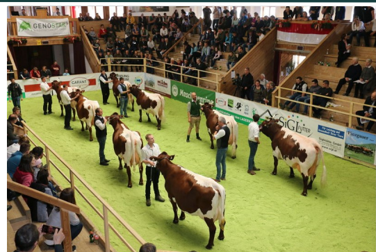
Die präsentierten Pinzgauer Kühe zeigten beeindruckend den Fortschritt der Zucht der letzten Jahre und waren beste Werbung für die Rasse. Gesamtsiegerin wurde die bekannte Schaukuh „Winni“ (V: Storm) vom Betrieb der Familie Reitstätter, Hackl aus Kössen.

Kärnten richteten die einzelnen Gruppen. Ein beeindruckendes Bild ergab die Vorstellung von sieben Dauerleistungskühen, die im Schnitt über 100.000 kg Lebensleistung aufweisen konnten. Die Jüngsten dürfen auf keiner Ausstellung fehlen und zeigten wie viel Freude sie im Umgang mit den Tieren haben. Alle Ergebnisse und einen ausführlichen Bericht erhalten Sie auf www.rinderzucht-salzburg.at