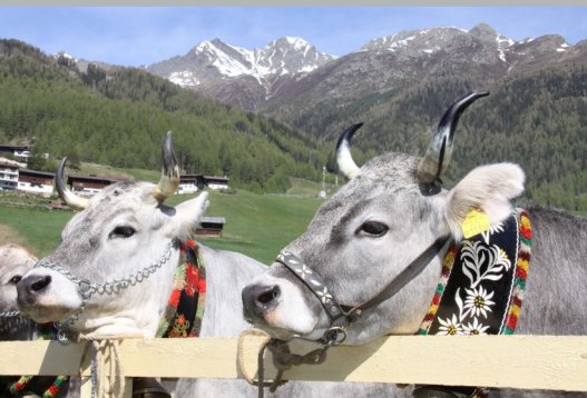
Weit über 200 Grauviehzüchter aus allen Teilen Österreichs präsentieren rund 400 hochwertige Zuchttiere.

chen und auf die unvergleichliche Geschichte und Tradition des Tiroler Grauviehs hinweisen. Im Mittelpunkt der kuisa stehen die Tiere. Neben einer Kunstaussstellung kommt die Kulinarik mit der Versorgung von hochwertigen regionalen Produkten nicht zu kurz. Der Gutshof der Landwirtschaftlichen Lehranstalt Imst lädt zum Tag der offenen Tür. Alle Infos unter www.kuisa.at