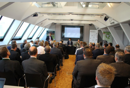
Die ZAR als Dachorganisation der österreichischen Rinderzucht hielt die diesjährige Generalversammlung im Dachgeschoss des BMNT ab.