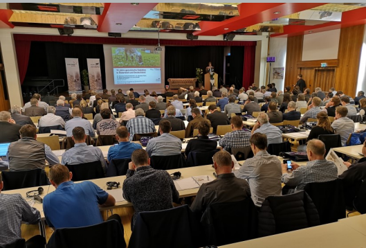
160 Kongressteilnehmer aus Europa und USA konnten begrüßt werden.

reits eine Stabstelle Forschung eingerichtet werden, um diesem in letzter Zeit sehr stark gewachsenen Forschungsbereich gerecht zu werden. Der Workshop Vermarktung sprach sich zu einem klaren Bekenntnis zur verstärkten gemeinsamen Zusammenarbeit in der Zuchtviehvermarktung aus.