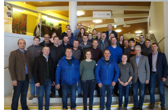
Das Kontrollpersonal der LKV Austria aus den verschiedenen österreichischen Bundesländern ist für die neue Kontrollsaison 2019 bestens vorbereitet und gerüstet.

Den ausführlichen Bericht lesen Sie auf www.zar.at